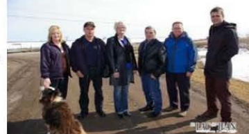
Avec les magnifiques couchers de soleil sur le lac Saint-Jean, ça pourrait être le genre de photos que l'on aurait l'occasion de réaliser avec les éoliennes en premier plan.