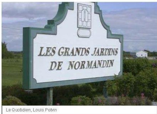
Le Quotidien, Louis Potvin